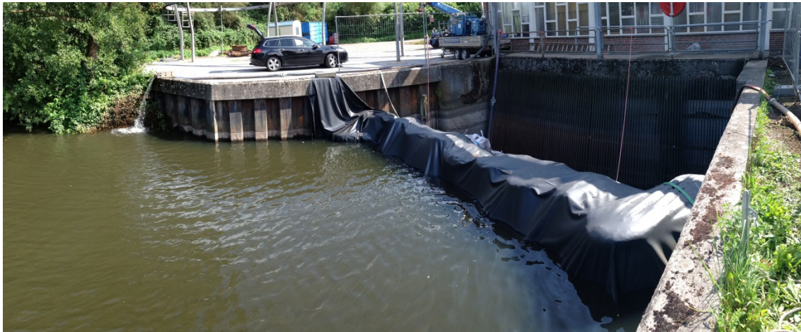
Abdämmung der Stecknitz mit einem Big Bag-Damm