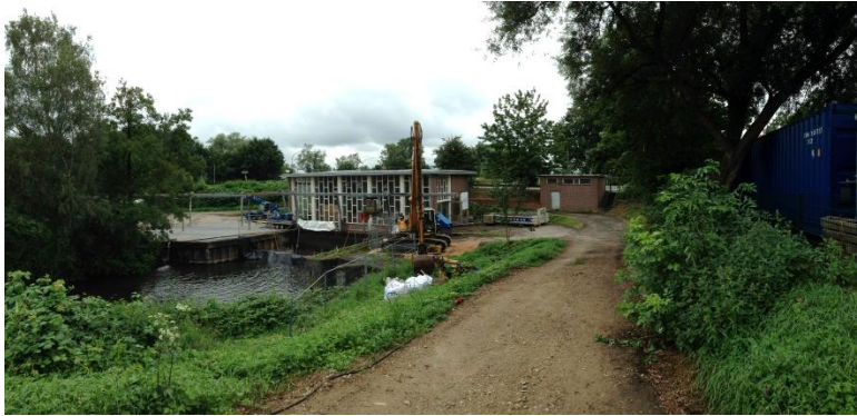
Ansicht Schöpfwerk Lauenburg

Das im Jahr 1965 errichtete Schöpfwerk in Lauenburg wird zur Entwässerung niedrig liegender Flächen mit einer Einzugsgebietsgröße von ca. 53 \text{ km}^2 + 1,9 \text{ km}^2 = 54,9 \text{ km}^2 (zwei Einzugsgebiete) betrieben. Bei Elbhochwasserständen > \text{NN} + 7,70 \text{ m} kann mittlerweile die Förderleistung nicht mehr garantiert werden. Daher war ein Ersatz der insgesamt vier Schöpfwerkspumpen vorgesehen.